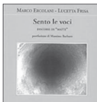
L'opera dei due autori